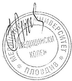
ГРАФИК за допълнителна поправителна изпитна сесия на специалност "Медицински лаборант" 16.09.2019 г. – 20.09.2019 г. учебна 2018 / 2019 година