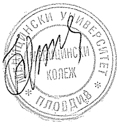
ГРАФИК за допълнителна поправителна изпитна сесия на специалност "Рехабилитатор" 17.09.2020 г. до 26.09. 2020 година учебна 2019/ 2020 година