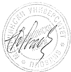
ГРАФИК за редовна изпитна сесия на специалност "Медицинска козметика" Летен семестър учебна 2019 / 2020 година от 08.06. до 17.07.2020 година