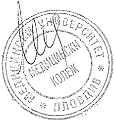
ГРАФИК за редовна изпитна сесия на специалност "Медицинска козметика" Летен семестър учебна 2020/ 2021 година от 02.06. до 17.07.2021 година