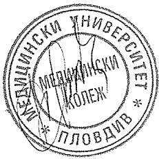
ГРАФИК за поправителна изпитна сесия на специалност „ Медицински лаборант ” зимен семестър на учебната 2020 / 2021 година 01.02 до 07.02.2021 година